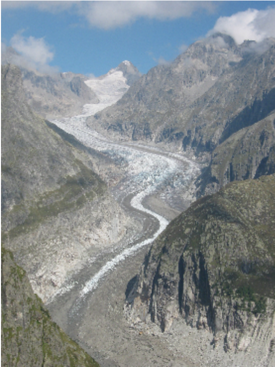
Der Fieschergletscher mit dem Oberaarhorn