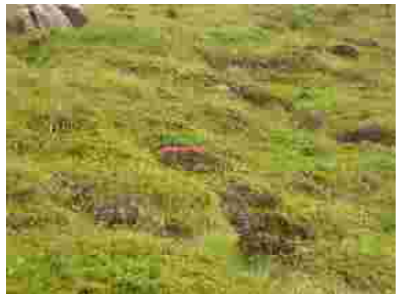
Beim Abzweiger zum alten Hotel Jungfrau