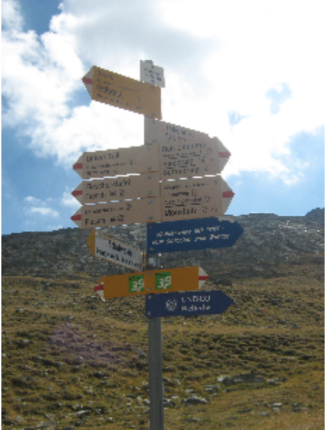
Viele Möglichkeiten für den Rückweg