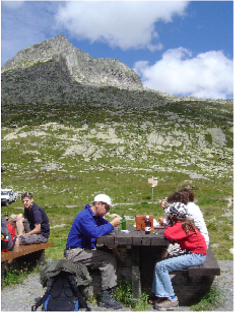
Älplermagronen bei der Gletscherstube