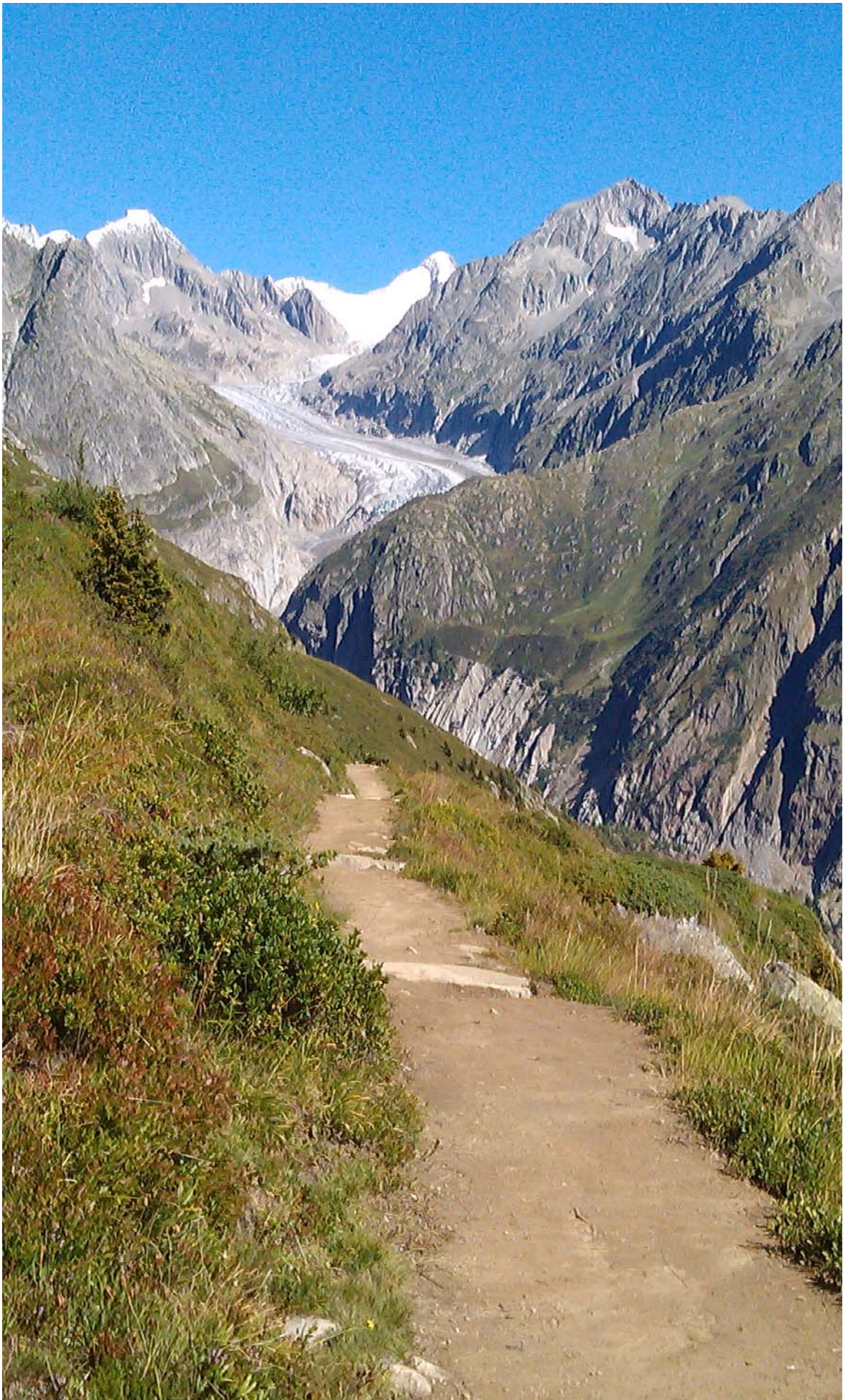
Der Fieschergletscher in seiner ganzen Pracht.