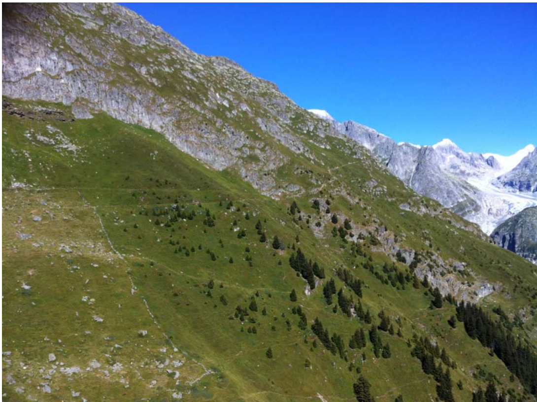
In der Bildmitte sieht man den Weg, um über das Tälli zur Gletscherstube zu gelangen.