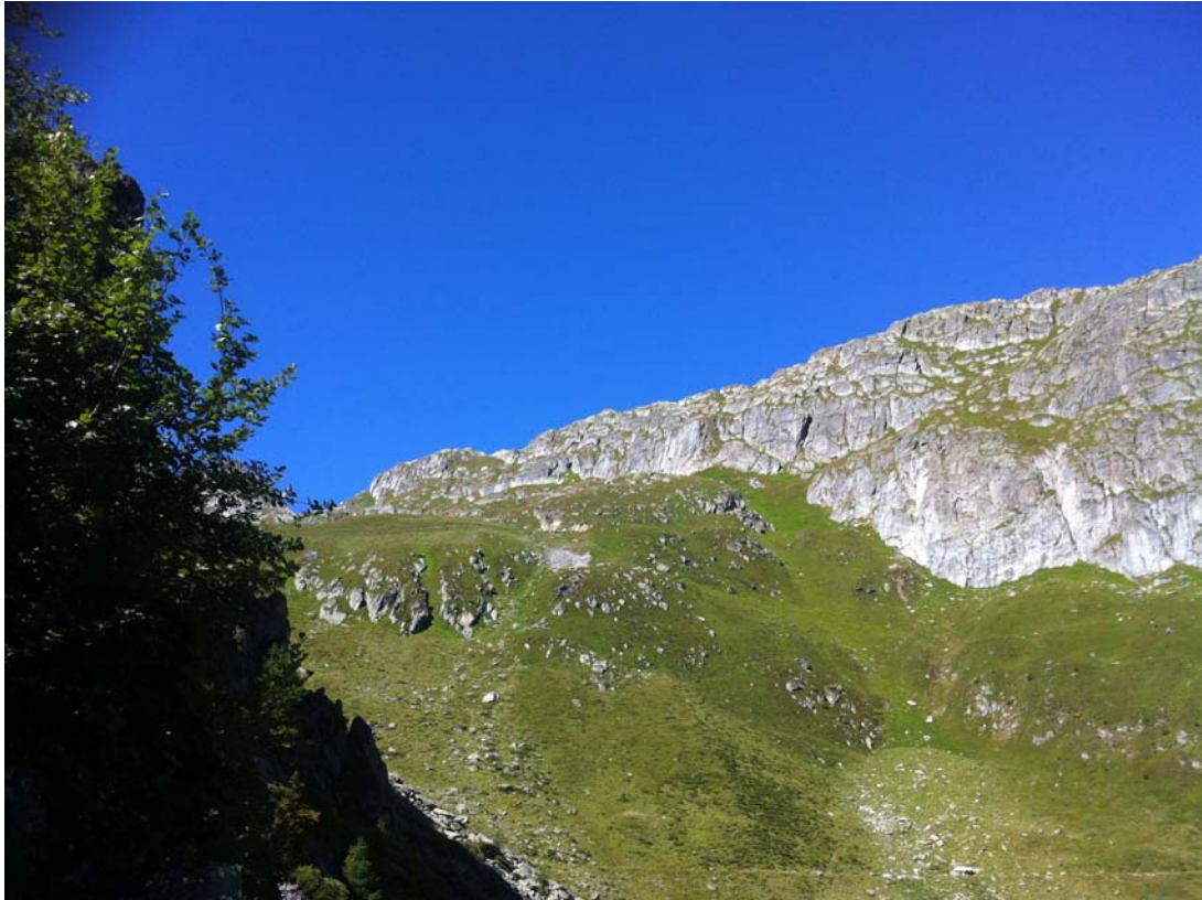
Genau in der Bildmitte ist der Eingang zum Tunnel, um zur Gletscherstube zu kommen.