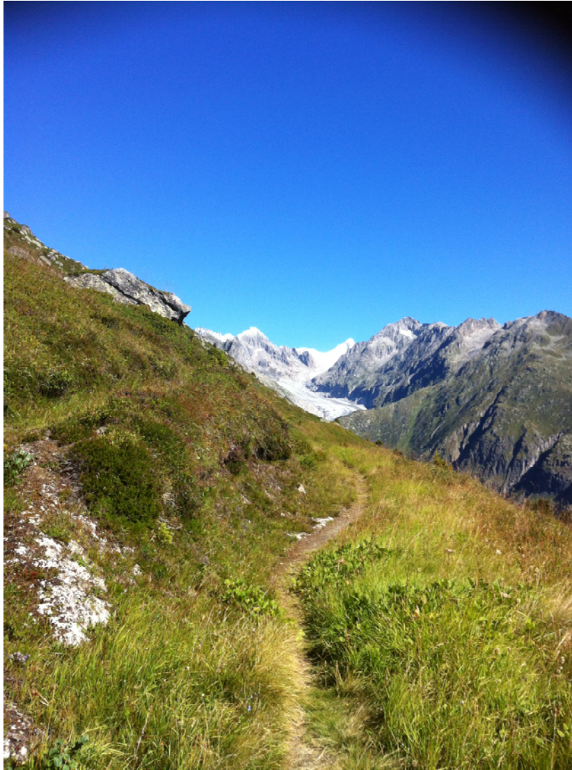
Friedlich und harmonisch – da geht der Stress von alleine weg.