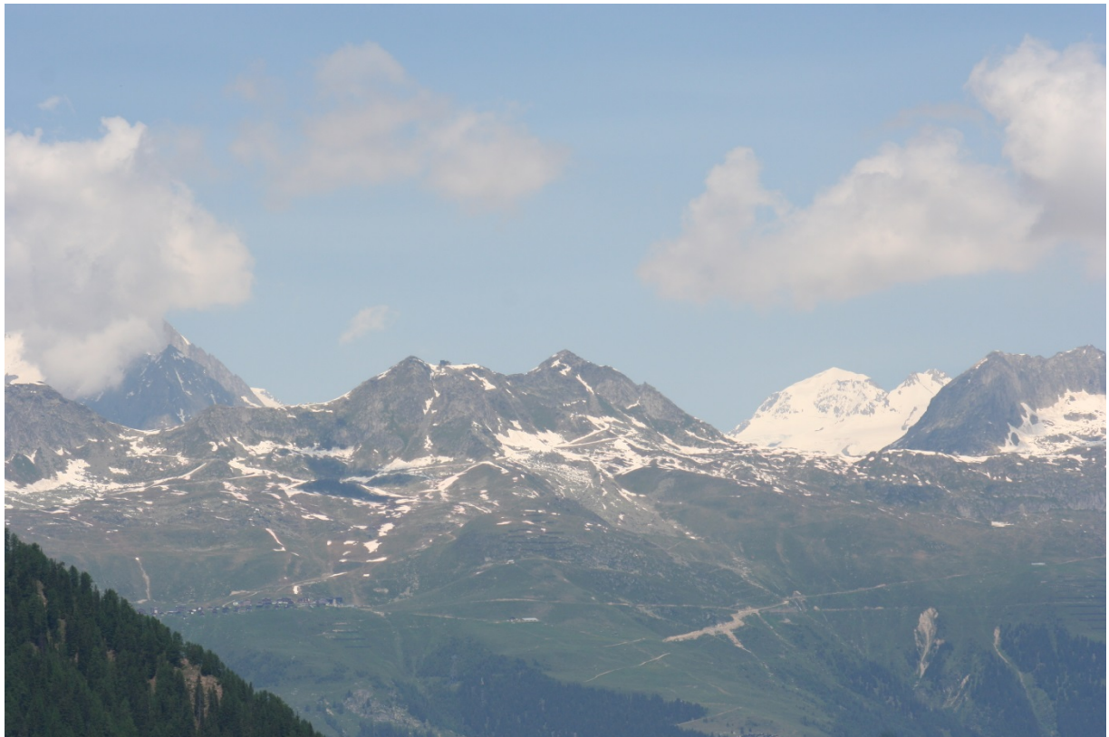
Der Chüeboden von Heiligkreuz aus gesehen mit Eggishorn-Bergstation, Eggishorn und Mönch